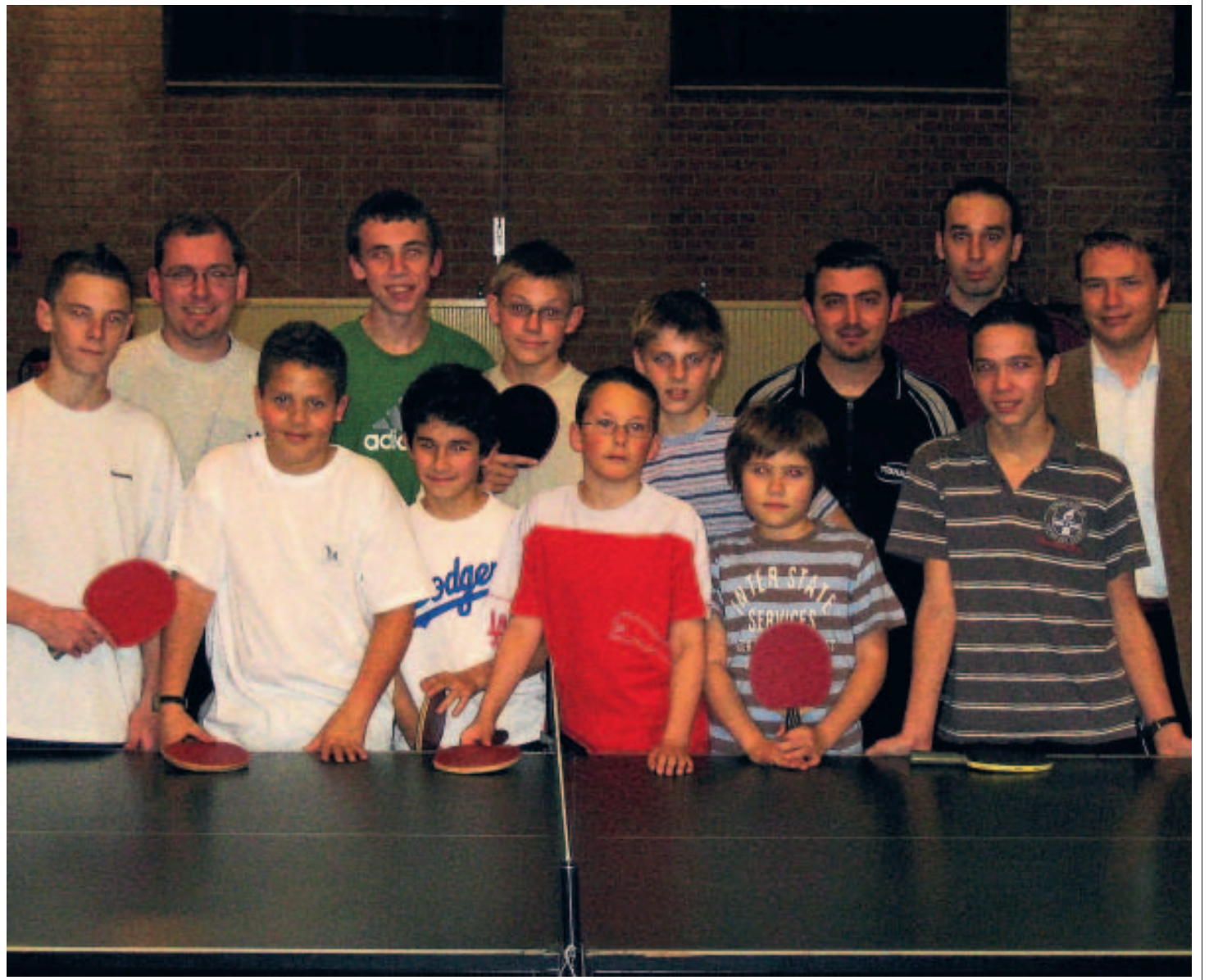
Les membres de l'AEDEC sont répartis en onze équipes, dont une féminine qui signe d'excellents résultats.